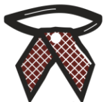
Галочка арт. 0415 БОРДОВАЯ В КЛЕТКУ