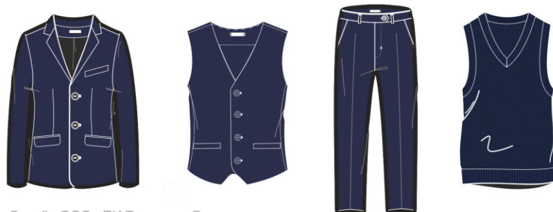
Дизайн ООО «ПК Броско». Все права защищены.